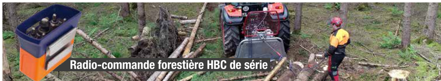
Radio-commande forestière HBC de série

• de série ○ option – non disponible 1 Avec une longueur de câble de série